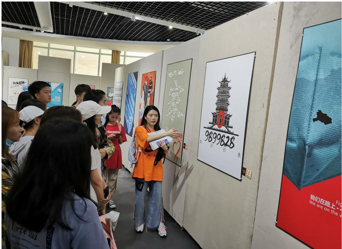
学生代表参观抗疫作品展