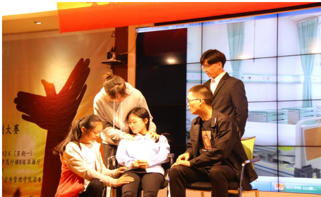
(“我与国旗合个影”活动)