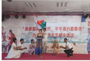
马达加斯加传统舞蹈