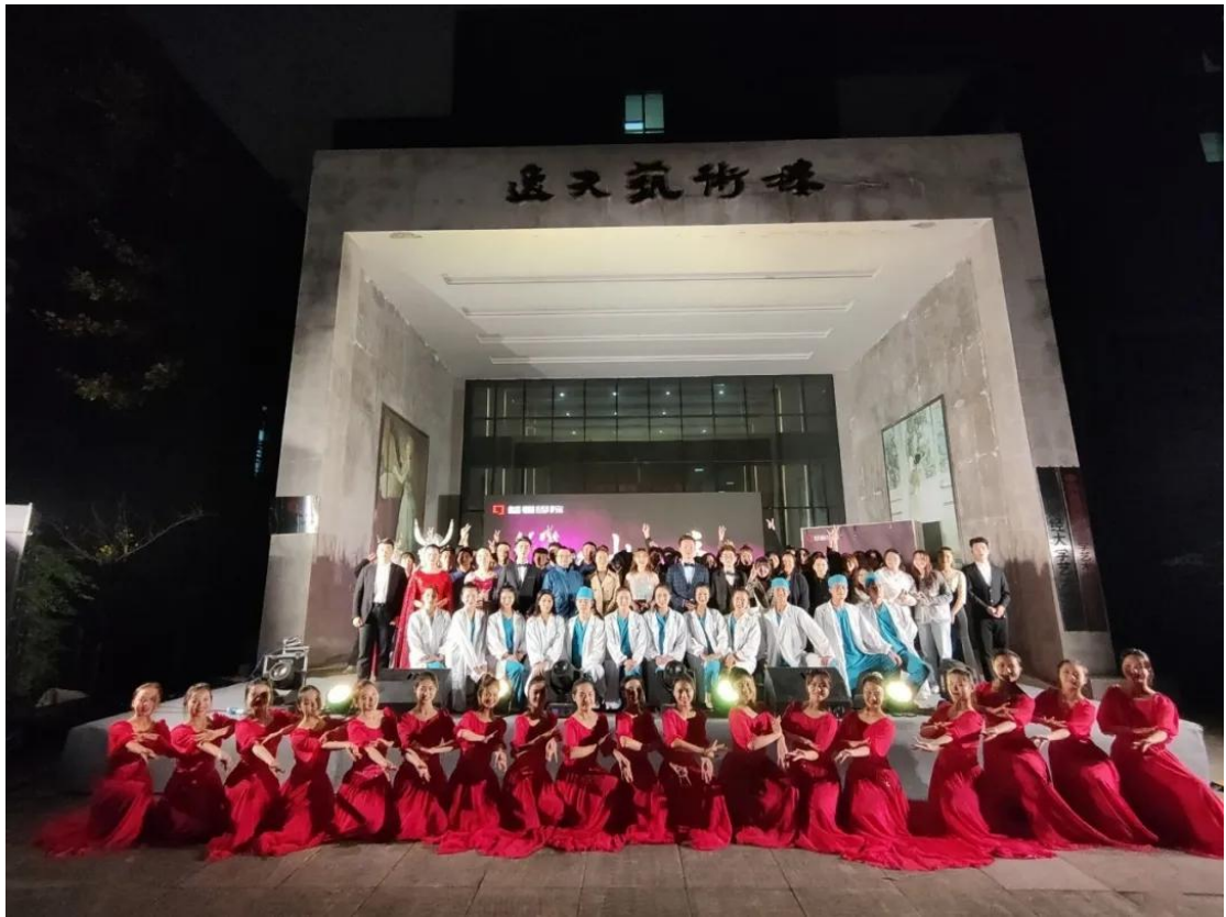
晚会全体演职人员合影留念

10.引导广大青年学生坚定“四个自信”，完成“读懂中国”、“全面小康，奋斗有我”的活动。今年10月，接到教育部《“读懂中国”活动“全面小康，奋斗有我”》文件，我院关工委领导小组高度重视，积极响应。通过拍摄并展示退伍学生、一线扶贫教师、抗疫志愿者的故事，体现了在实现全面小康的道路上，教师和学生都在积极参与，贡献自己的力量。拍摄的《全面小康，奋斗有我》在“视频类”作品中获得了肯定，被推选至贵州省教育厅参加省赛。10月27日，我院联合文法学院在乐学楼1-1开展增强“四个意识”、坚定“四个自信”、做到“两个维护”精神的专题讲座，诚挚邀请学校关工委老同志游来林老师出席此次活动。