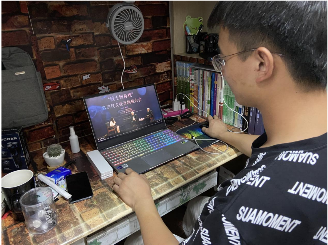
(大数据统计学院供稿)