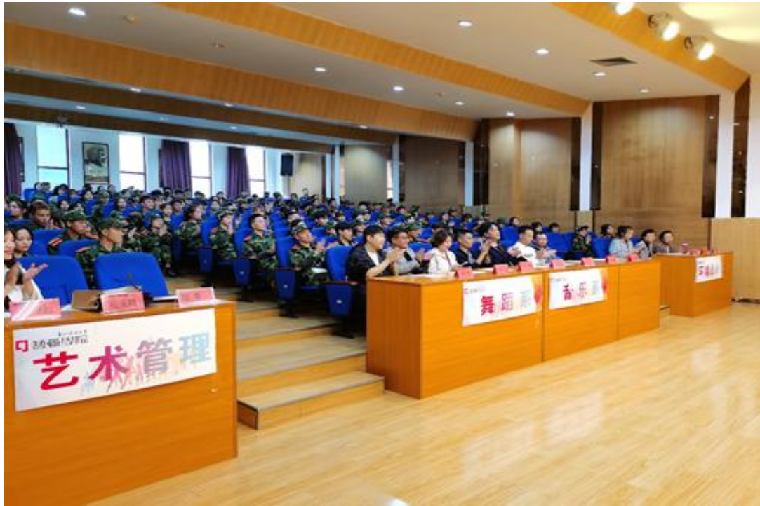
艺术学院 2020 级新生教育

艺术学院秉承厚德、博学、笃行、鼎新的校训精神，紧紧围绕精艺术、懂管理、会营销的人才培养目标，在学校党委、行政的领导下，和校关工委的指导下，全院师生密切配合，积极开展各项活动，不断提高全体教师的思想政治意识，引导学生、鼓励学生、关爱学生，从而培养出合格、优秀的大学生。