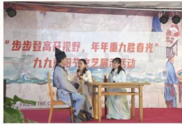
小品《新白娘子传奇》