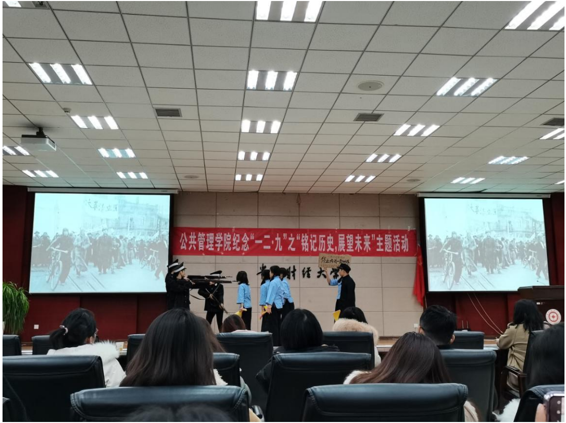
(纪念“一二·九”之“铭记历史，展望未来”主题活动)