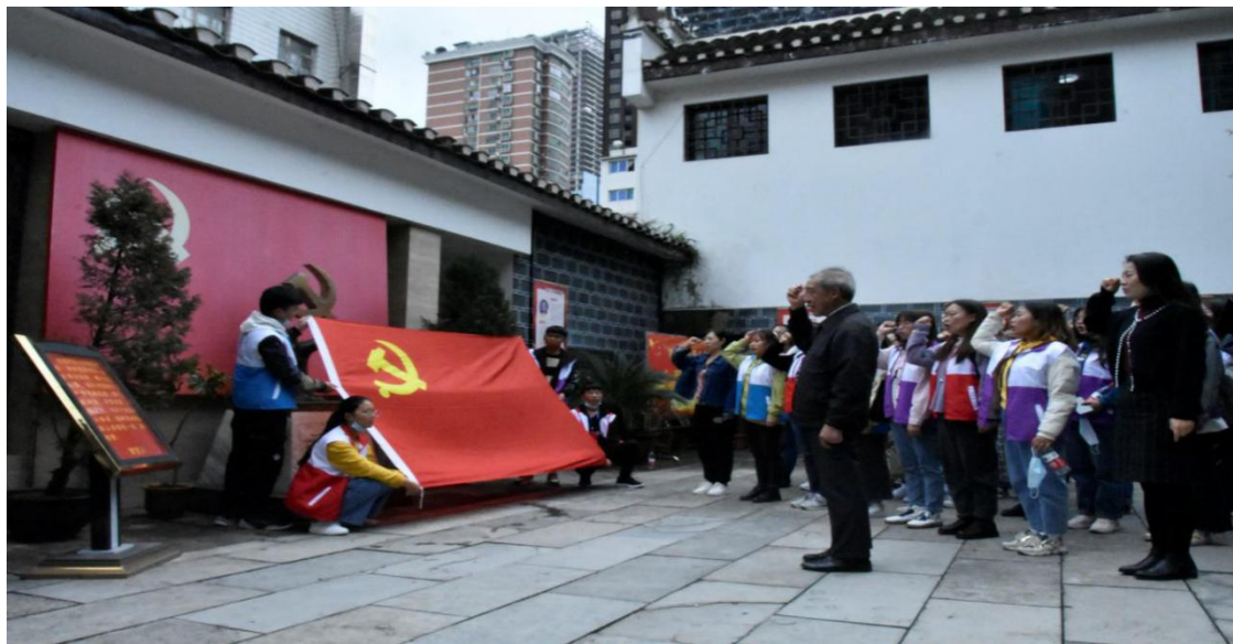
我院关工委参观省工委旧址