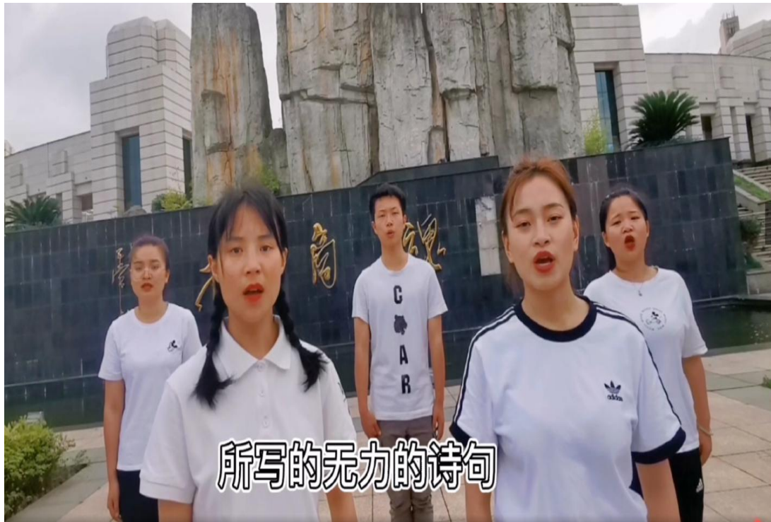
(4、朗诵比赛参赛作品)