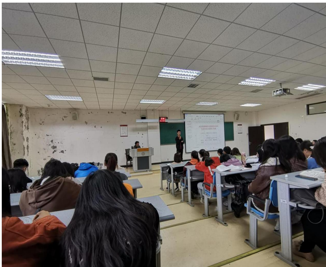
学生代表上台发言

11.爱国爱校，培养爱国主义精神。习近平总书记在中共中央政治局第二十九次集体学习时讲过，要在广大青少年中开展深入、持久、生动的爱国主义宣传教育，让爱国主义精神在广大青少年心中牢牢扎根，让广大青少年培养爱国之情、砥砺强国之志、实践报国之行，让爱国主义精神代代相传、发扬光大。我院利用新生入学教育，让学生了解学校的成长历史，增强学生的爱校热情，培养学生的爱国主义精神。