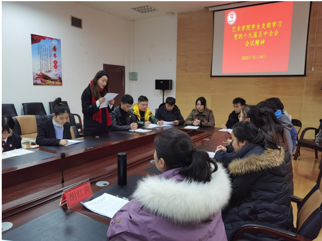
学生党员代表作交流发言