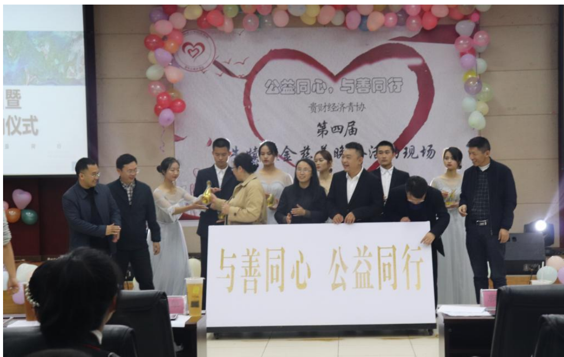
经济学院举办“牛犊基金”慈善晚会