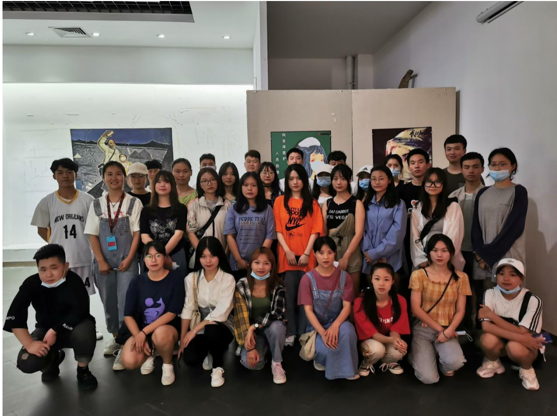
学生代表参观抗疫作品展