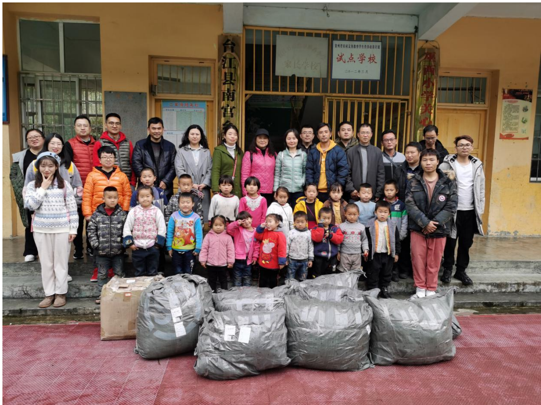
（到台江县南官镇巫西村巫西小学开展“心连心 暖寒冬”捐赠活动合影）