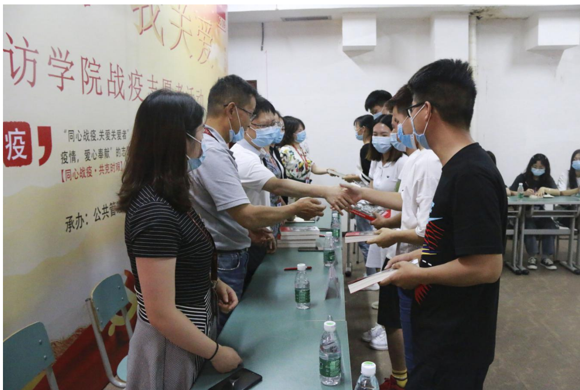
(校长赵普为学院参加抗疫活动的学生志愿者赠书)

本年度中，开展了两个紧扣学习抗疫精神和脱贫攻坚主题的活动，效果甚好。一是开展的“你奉献 我关爱”校长走访学院战疫志愿者活动。由校长赵普带队到宿舍走访慰问我院 10 余名在战疫防控工作中“关心疫情，付出爱心”的学生志愿者，对学院参加抗疫活动的志愿者送上一本好书：《习近平的七年知青岁月》，赵普校长在书上题字，勉励同学们“志存高远，脚踏实地，关注社会，关注民生，做新时代最勇敢的人”，开展了一堂生动深刻的人文关怀课、思政课。