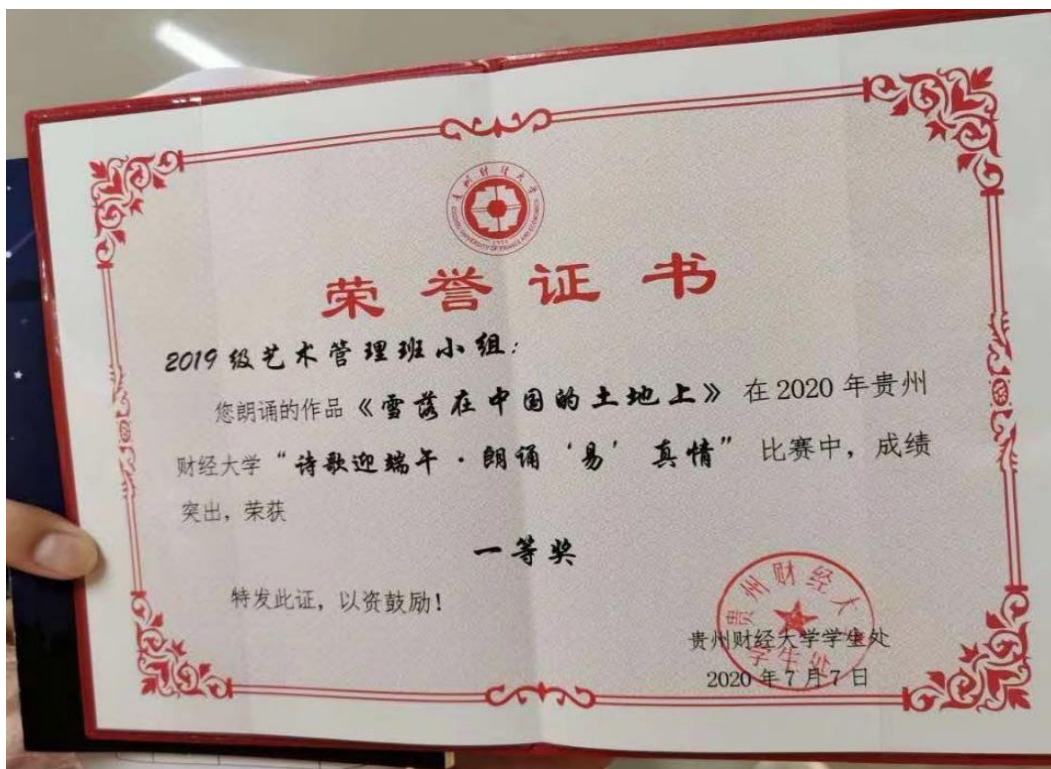
(5、参赛作品获奖证书)

5.关爱学生，携手抗疫。突如其来的新冠疫情，使许多学生的家庭经济陷入了窘迫，我院开展“关爱建档立卡学生”的活动。