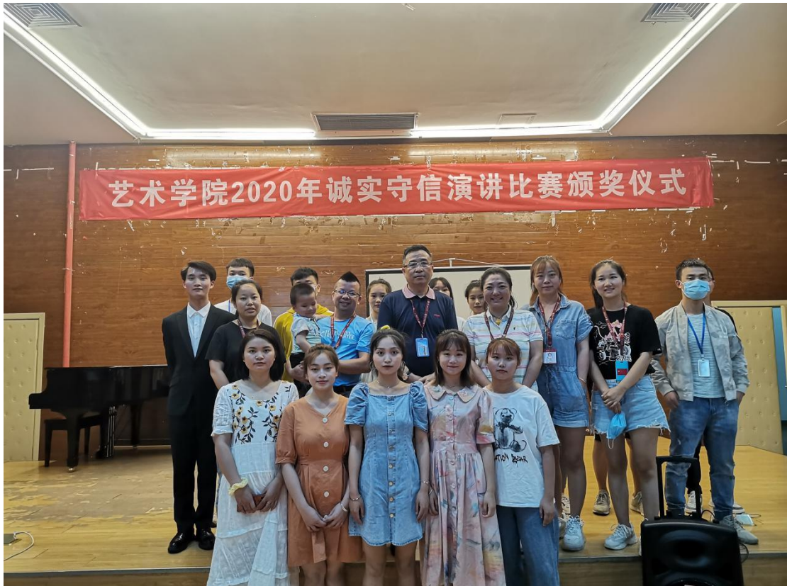
诚实守信演讲比赛颁奖仪式

4. 弘扬中国传统文化，增强学生的文化自信。在今年的端午节来临之际，我院积极组织学生参加学校易班举办的《2020年“诗歌迎端午 朗诵‘易’真情”比赛》，报送的作品分别获得了一个一等奖、一个二等奖、一个三等奖、三个优秀奖的荣誉。