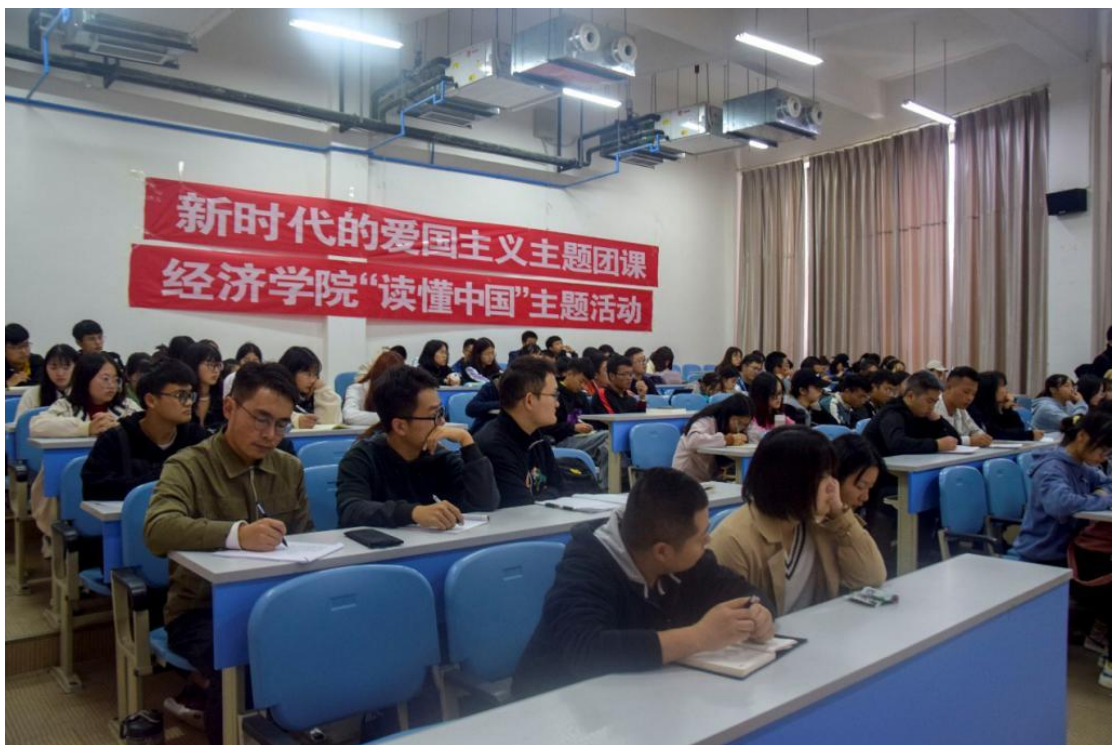
经济学院举办读懂中国活动

此外，学院关工委还在校关工委的指导下围绕《习近平谈治国理政》一书，积极开展读懂中国活动。