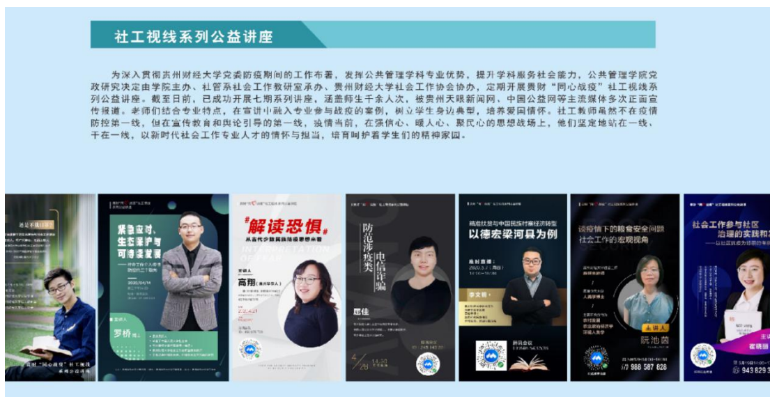
(贵财“社工视线”系列公益讲座海报)

二是上好疫情思政课。学院党委领导班子分别结合疫情给学生在线上形势政策课，引导学生以轻松平和的心态度过疫情，并鼓励学生积极参加当地组织的抗疫工作，成为抗疫志愿者。另外，充分利用师资和专业优势，聚焦抗疫，在疫情期间线上开展了4期“同心战疫”公管党建视线系列专题讲座和9期贵财“社工视线”系列公益讲座，对习总书记关于新冠肺炎疫情防控的系列重要讲话精神、抗疫故事、抗疫知识等进行了宣传和解读，带领学子理性抗疫，并从专业视角来学习抗疫知识，学习抗疫楷模，领会中国精神。其中，社工视线系列讲座被贵州天眼新闻网、中国公益网等媒体多次报道。