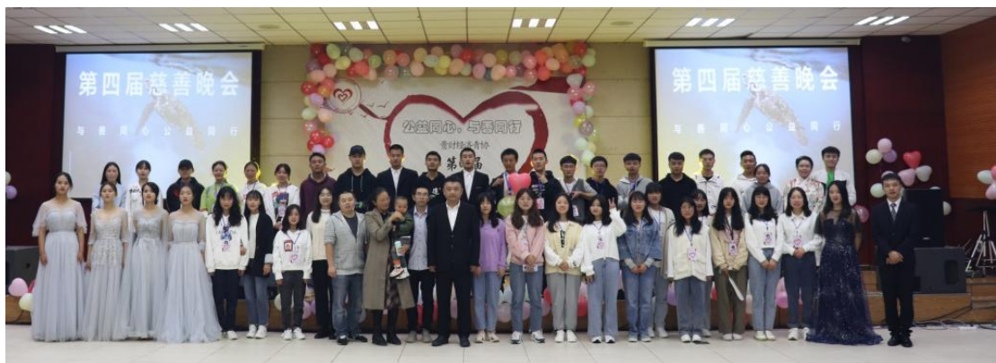
经济学院举办“牛犊基金”慈善晚会