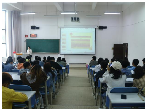
(学院关工委组长及成员给学生上党团课)